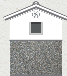
モルタル洗い出し