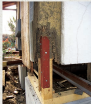
柱・土台取り換え